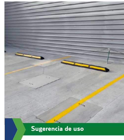
Sugerencia de uso

Nota: las dimensiones pueden variar un 5%